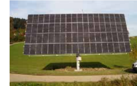
Photovoltaik-Anlagen jeder Größenordnung