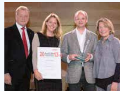
Niederösterreichs erfolgreichster Lehrbetrieb „Ausbilder Trophy 2013“ - Sparte Gewerbe & Handwerk