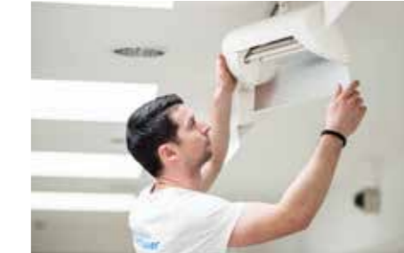
Montage und Wartung