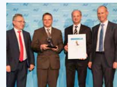
Auszeichnung „Model of best practice“ - Silberner Daumen der AUA für „Hände gut, alles gut“