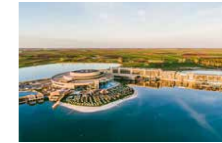
St. Martins Therme & Lodge