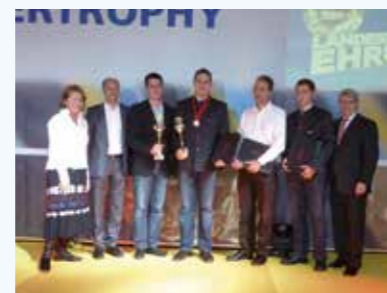
Viele weitere Auszeichnungen wie Bundessieger und Landessieger